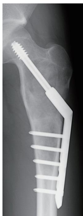
術後 2 ヶ月