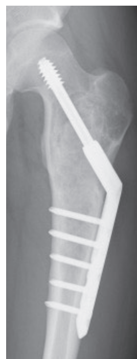
術後 8 ヶ月